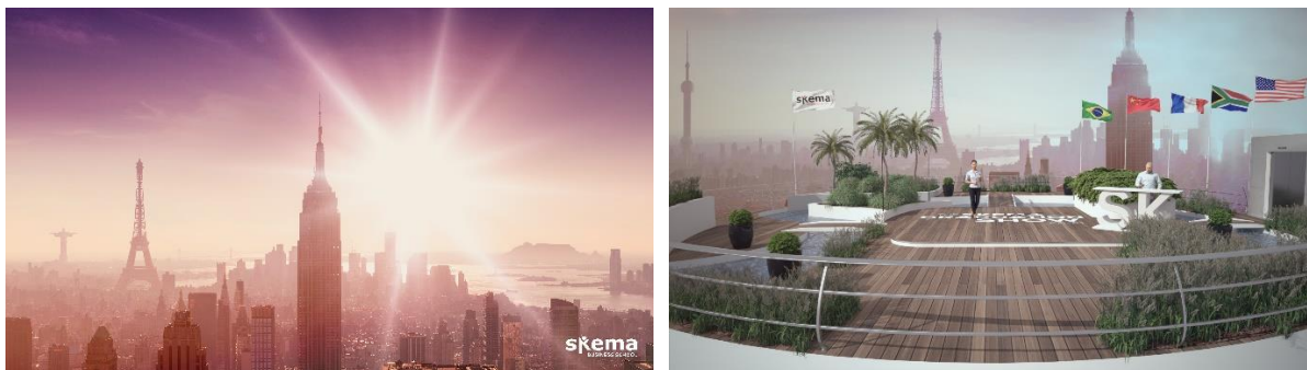
A gauche, la cité imaginaire SKEMAPOLIS. A droite le studio de cinéma 3D où se déroulera le SKEMA Graduation Show, le 12 juin 2021.

En raison de la pandémie, SKEMA Business School a choisi d'organiser l'édition 2020-2021 de sa traditionnelle cérémonie de remise des diplômes entièrement en ligne sous le nom « The SKEMA Graduation Show ».